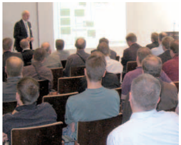
Profinet-seminari kiinnosti kävijöitä

Esittelimme messuilla tuotteita kaikista tuoteryhmistämme, ja keskustelut asiantuntevien kävijöiden kanssa uusista tuotteista ja ratkaisuista tekivät messuista todella mielenkiintoisen ja hyödyllisen. Kiitoksia kaikille osastollamme käyneille!