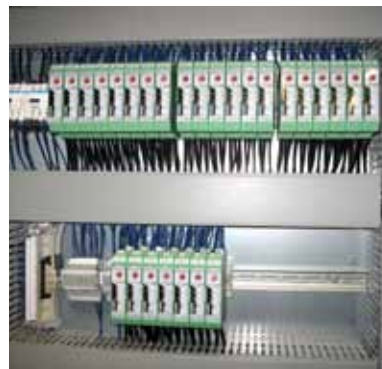
Contactronissa on 22 millimetriin saatu mahtumaan neljän kontaktorin, lämpöleean ja välireletoiminnot. Tässä asennuksessa tilansäästö on huomattava.