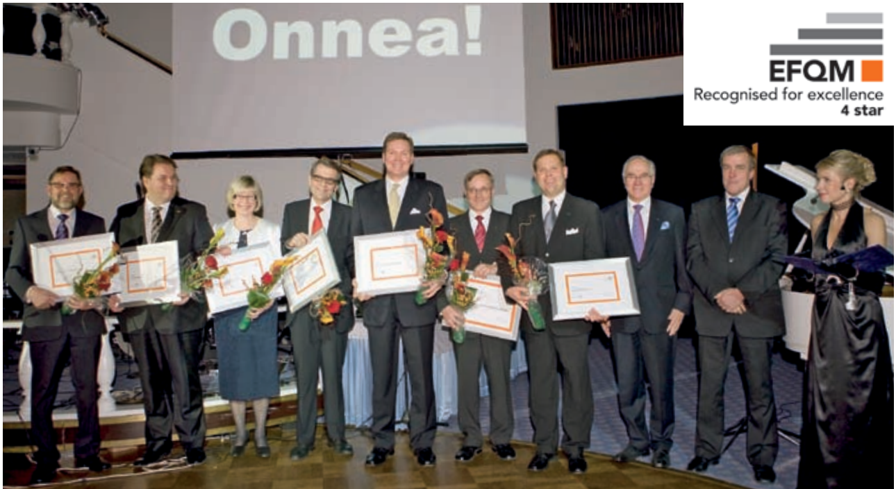
Yhteiskuva kaikista Recognised for Excellence -tunnustuksen saajista.

Tänä vuonna otimme ensimmäistä kertaa osaa Suomen laatupalkintokilpailuun, jossa meidän toimintamme arvioitiin heti Recognised for Excellence –tunnustuksen arvoiseksi. Tämä on harvinainen saavutus ensi yrittämällä ja hieno kiitos systemaattisesta kehitystyöstä koko meidän organisaatiollemme! Tunnustus myönnetään organisaatioille, jotka saavuttavat vähintään 400 pisteen rajan, mutta eivät kuitenkaan vielä sarjansa voittoa.